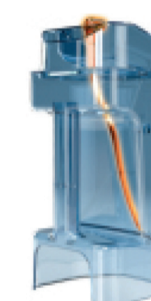
Контейнер для очистки молочной системы