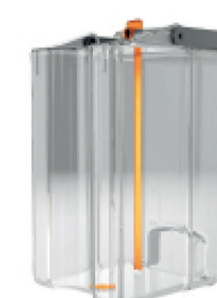
Контейнер для молока