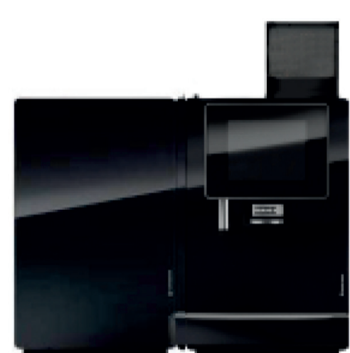
SU05 / SU12