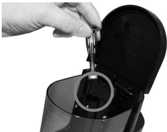
Кисточка для очистки вставлена в перемалывающее устройство