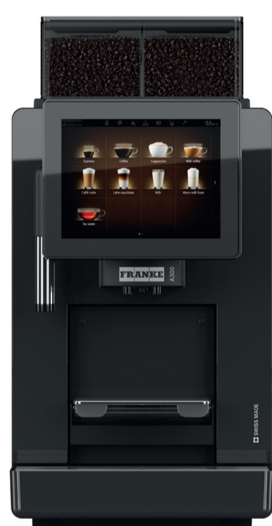
A300 NM 1G 2P H1