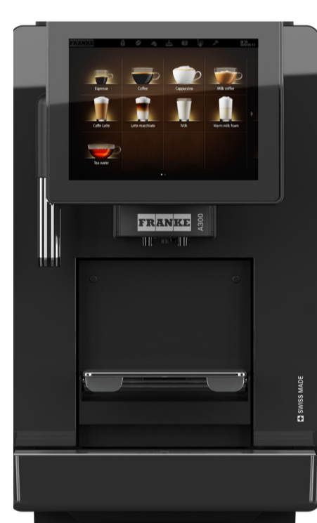
A300 MS EC 1G H1