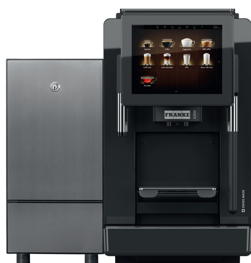
с холодильником KE200 (4л)