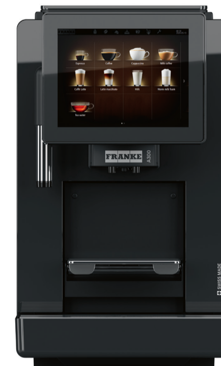
300 FM EC 1G H1