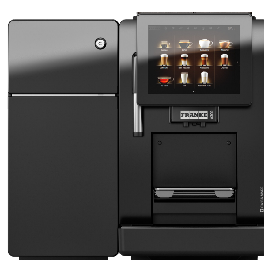
с холодильником SU03 (3 л)