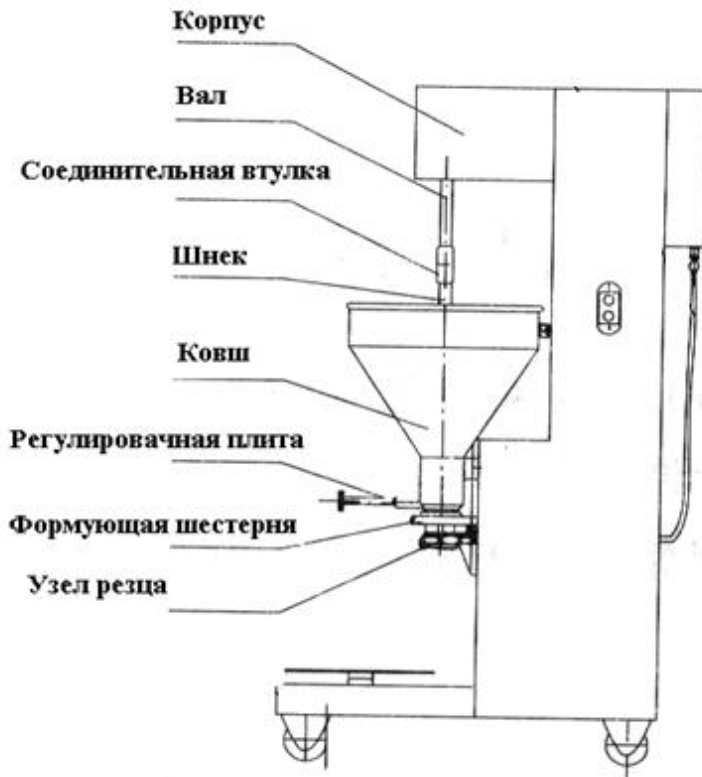
Рис. 1 Общие вид, основные элементы оборудования

Данное оборудование состоит из: корпуса, электродвигателя и механизма передачи (редуктор), серия валков и т.д. (смотрите рис. 1, рис. 2) (представленные эскизы могут отличаться от действительности, но основная компоновка оборудования не изменяется).