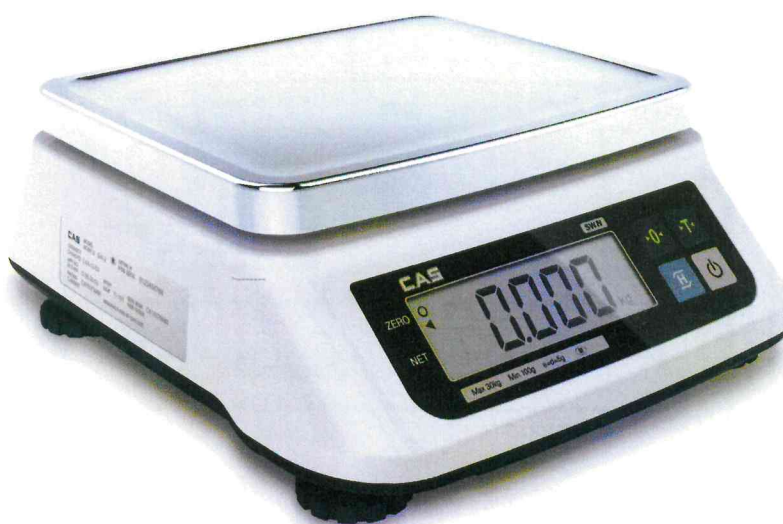
Рисунок 1 - Общий вид весов

Общий вид весов представлен на рисунке 1.