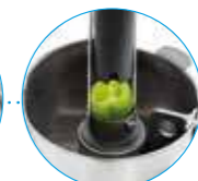
Толкатель Exactitube Ø 39 мм