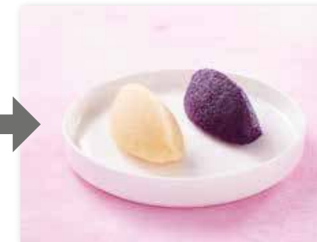
Дуэт из свежей краснокочанной капусты и сельдерея