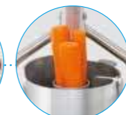
Цилиндрическая воронка Ø 58 мм