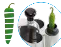
Толкатель Exactitube Ø 39 мм

R 502 Воронки для фруктов и овощей любых размеров