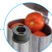
Большая воронка Крупные овощи

R 752 Воронки для фруктов и овощей любых размеров