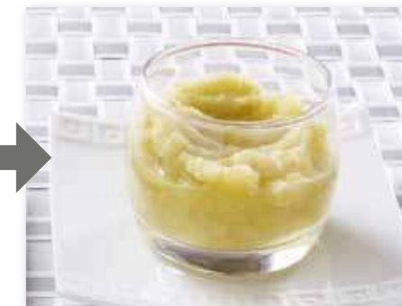
Пюре из свежих яблок гренни смит