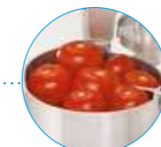
Широкая воронка XL Крупные овощи

R 752 Воронки для фруктов и овощей любых размеров