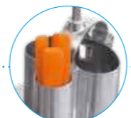
Цилиндрическая воронка Ø 58 мм