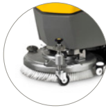
Регулировка давления прижима щетки