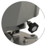
Передняя ручка регулирующая угол наклона щетки