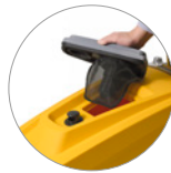
Съемная крышка + поплавки + фильтр