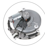
Всасывающая балка и вращение (до 270°)