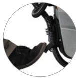
Подъем всасывающего устройства с помощью педали